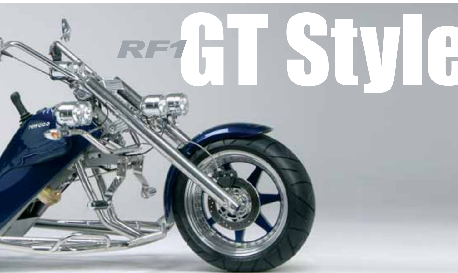
Colours - No. 08