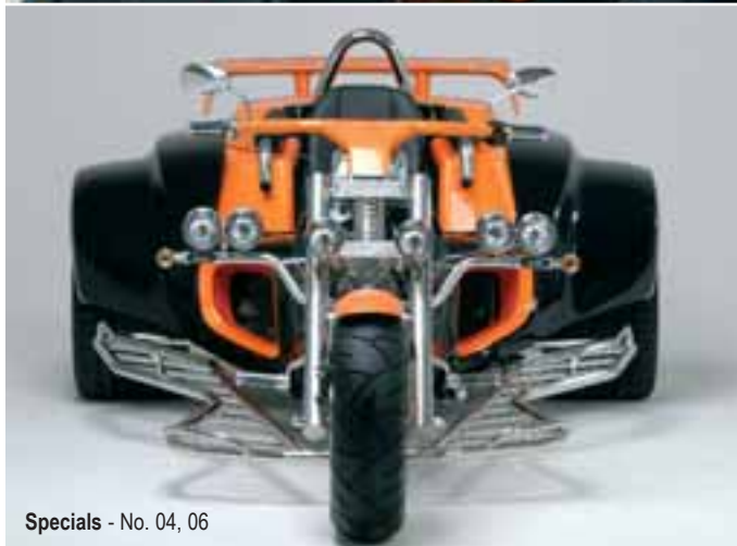
Specials - No. 04, 06