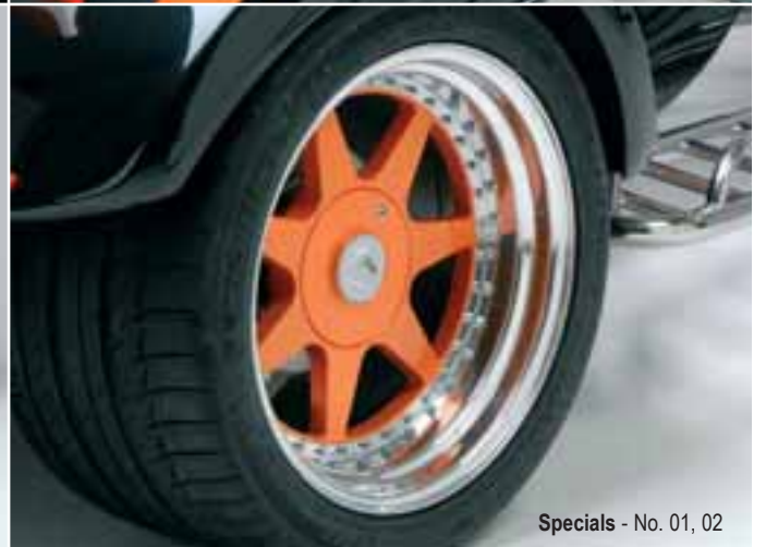
Specials - No. 01, 02