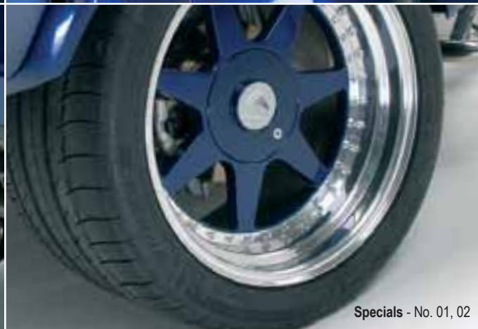
Specials - No. 01, 02