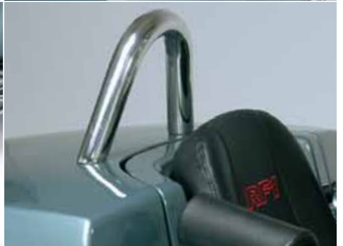
Specials - No. 06, 07