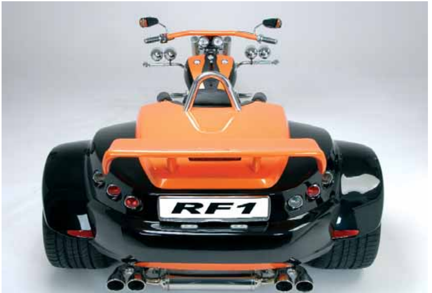
Colours - No. 05, 06 (Bi-Colour)