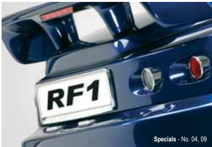
Specials - No. 04, 09