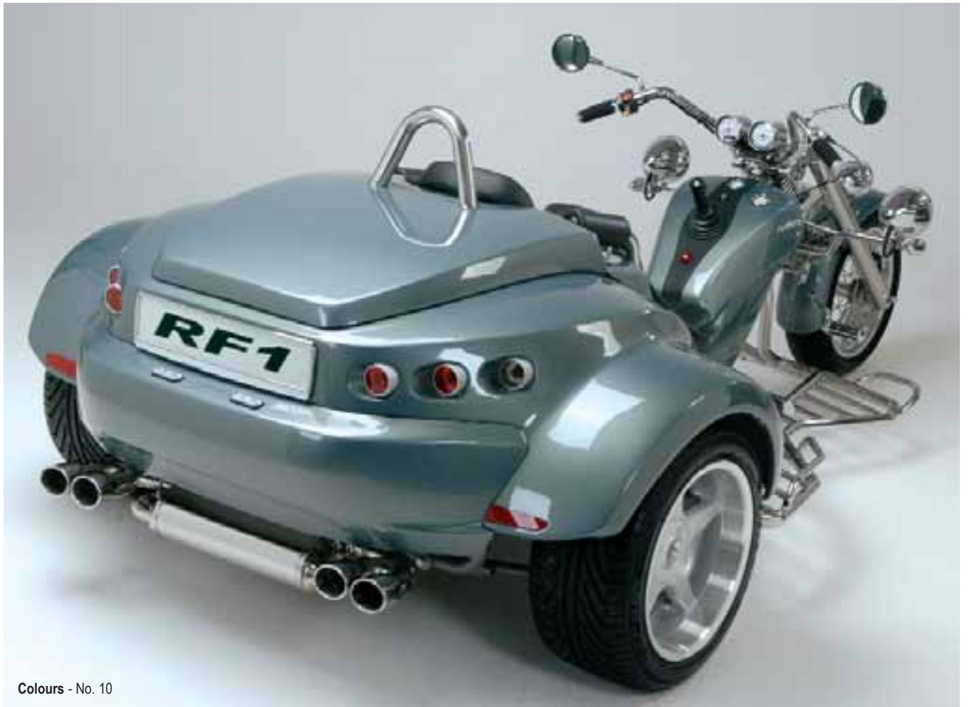
Colours - No. 10