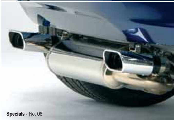
Specials - No. 08